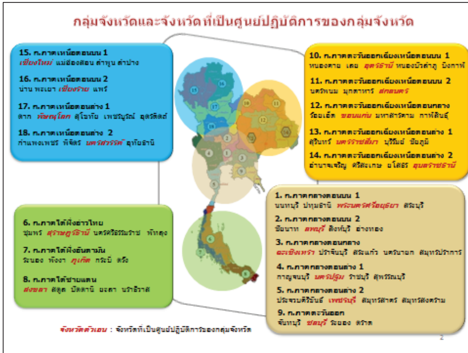
ภาพที่ 2: การจัดตั้งกลุ่มจังหวัด 18 กลุ่มจังหวัด