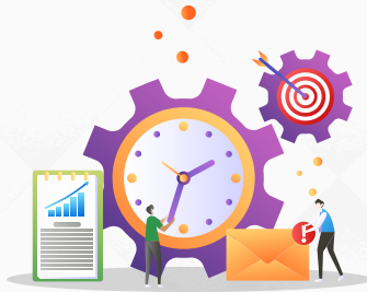
การประกาศช่องทางอิเล็กทรอนิกส์ฯ ตามมาตรา 10