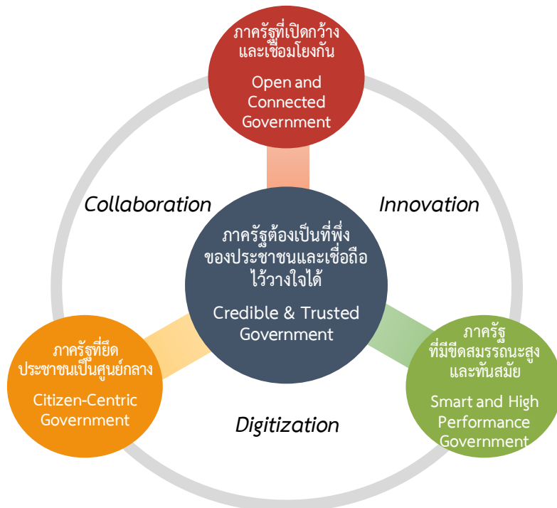
ภาพที่ 1 ระบบราชการ 4.0